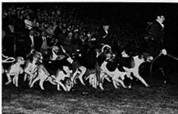
Equipage de Brottonne